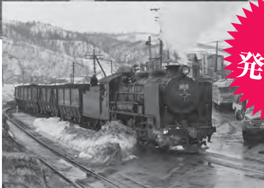
三菱大夕張鉄道保存会 岩見沢分館 1270年3月26日撮影