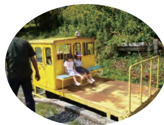
モーターカー走行展示