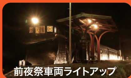
前夜祭車両ライトアップ