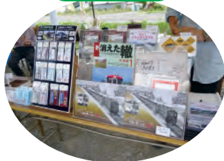
オリジナルグッズ販売